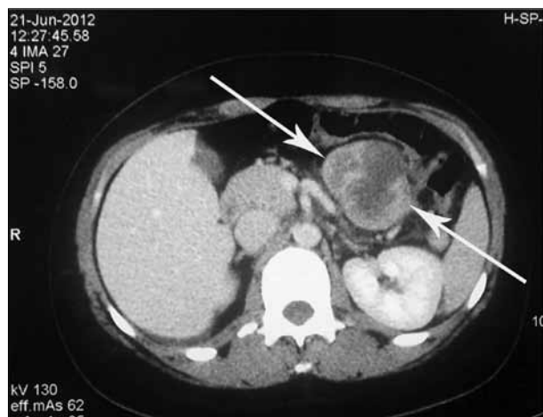
Слика 1. Налаз компјутеризоване томографије абдомена с тумором почетног дела јејунума

Figure 1. Computed tomography of the abdomen with a tumor of the initial portion of the jejunum